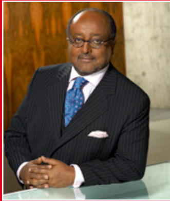
Dr. Asfa-Wossen Asserate

Prinz von Äthiopien und Herausgeber des Bestseller Buches „Manieren“