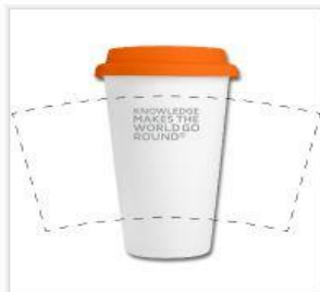
Keramik-Thermobecher mit Silikondeckel